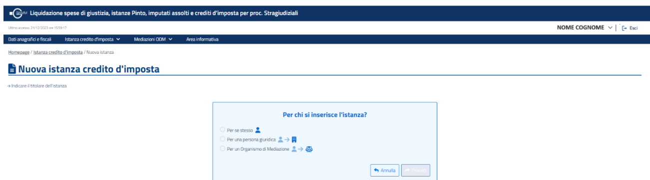
Figura 5 Scelta per la presentazione dell'istanza

Come prima passo l'utente deve indicare per chi si sta presentando la richiesta del credito d'imposta.