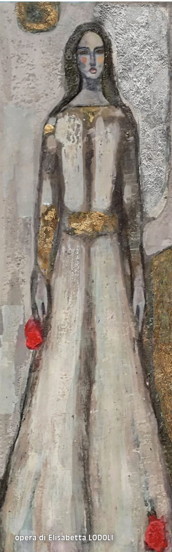
opera di Elisabetta LODOLI