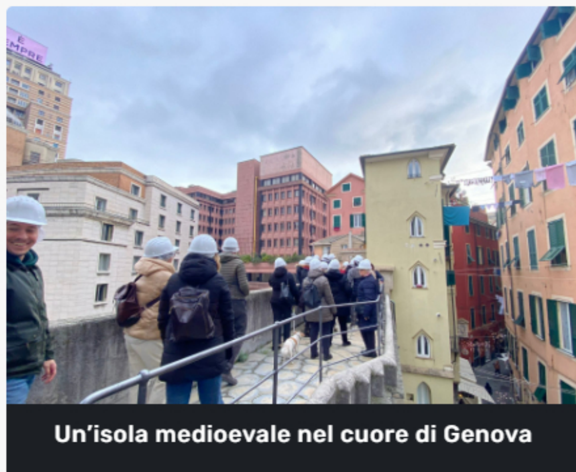
Un'isola medioevale nel cuore di Genova