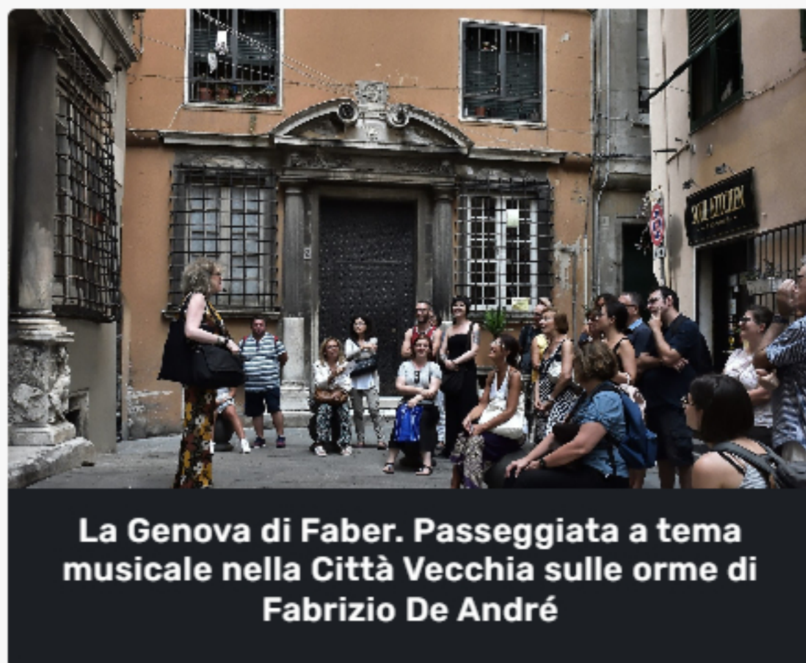
La Genova di Faber. Passeggiata a tema musicale nella Città Vecchia sulle orme di Fabrizio De André