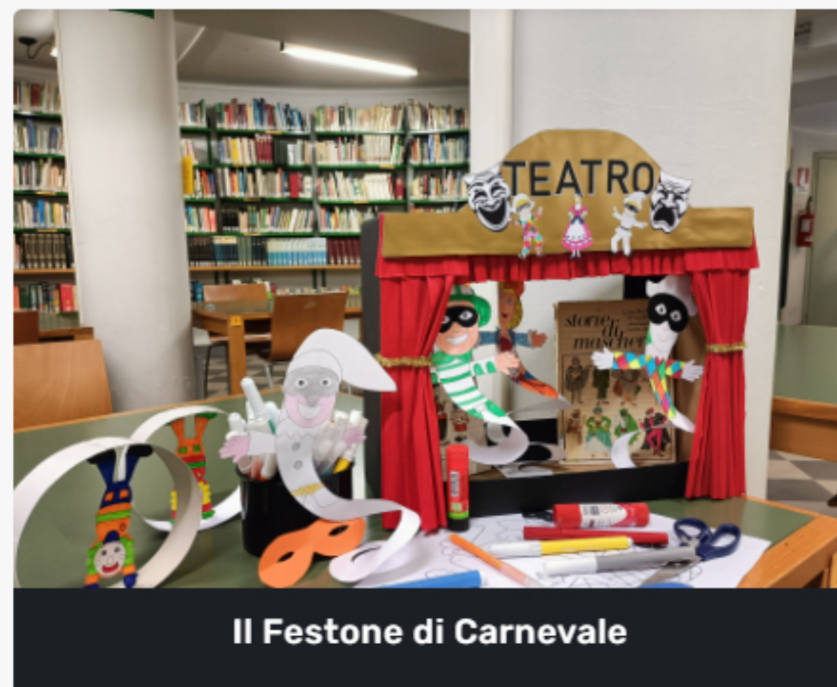
Il Festone di Carnevale