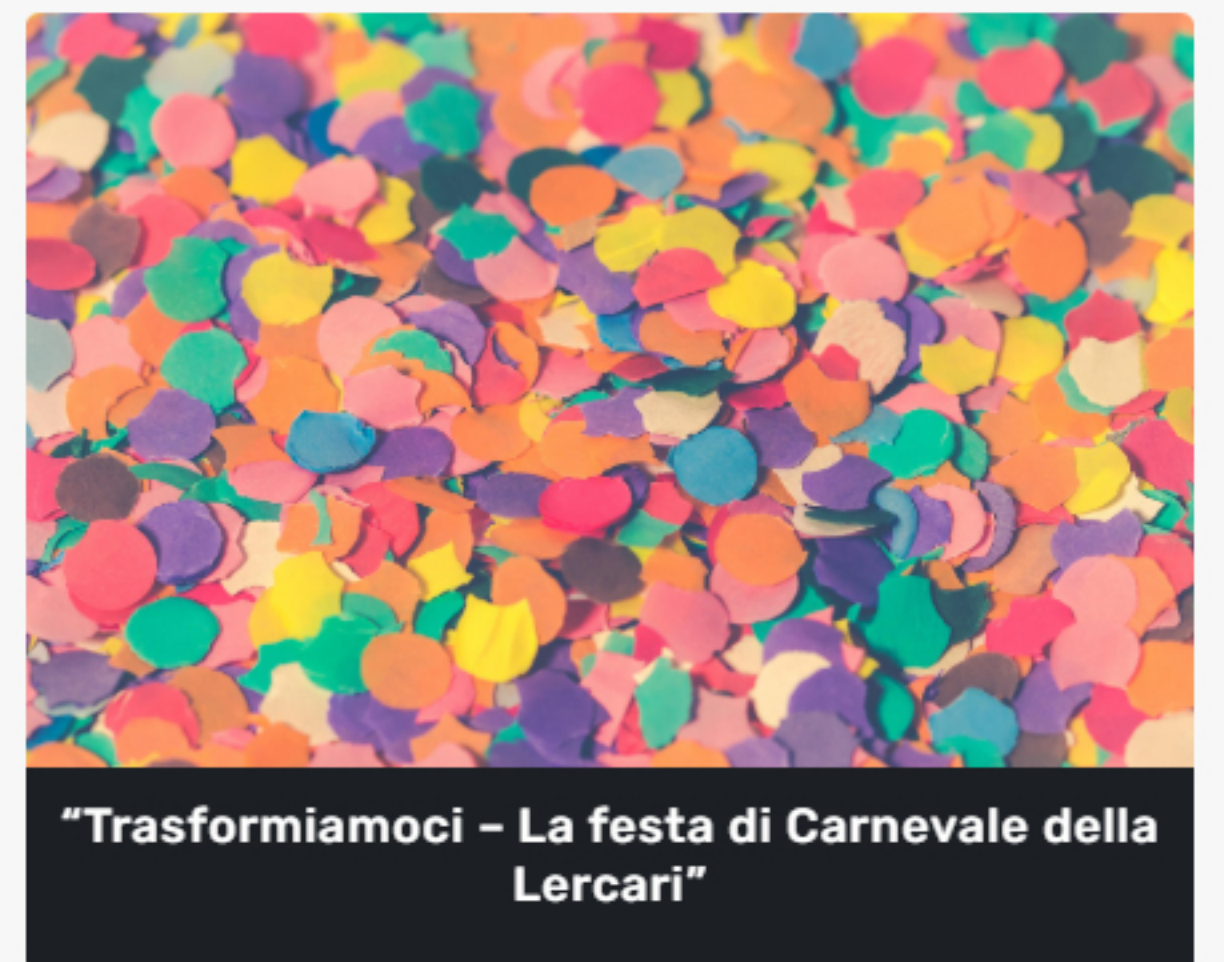
"Trasformiamoci - La festa di Carnevale della Lercari"