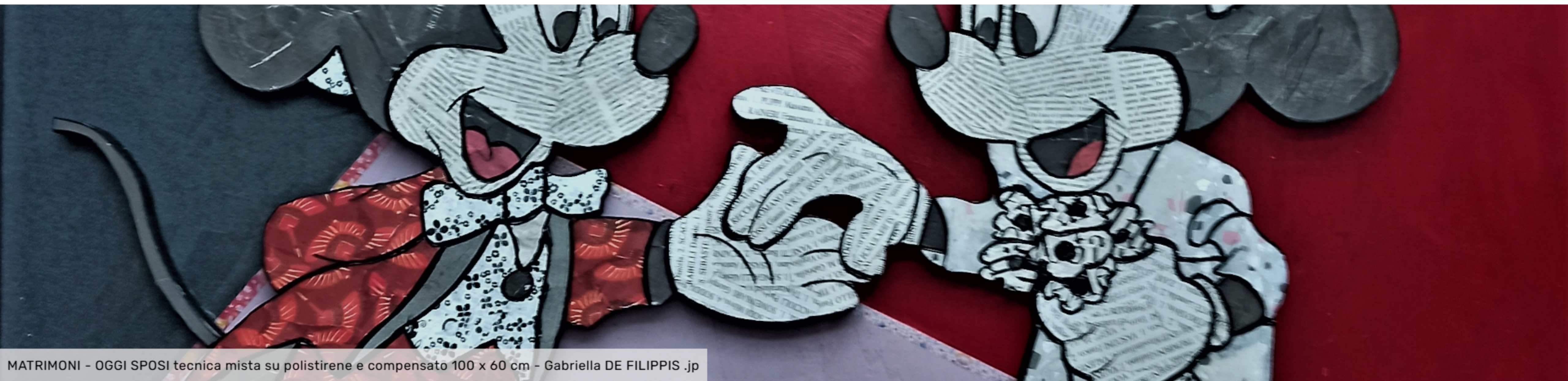
MATRIMONI - OGGI SPOSI tecnica mista su polistirene e compensato 100 x 60 cm - Gabriella DE FILIPPIS .Jp

Home / Eventi / Matrimoni - usi e costumi